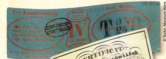
Fahrschein der Kaiser-Ferdinands-Nordbahn von Lundenburg nach Wien; Freifahrschein für Alois Negrelli, Gattin und Kinder auf Lebenszeit.

Auch in der Revolution 1848 spielte die Nordbahn eine Rolle. Die aufgebrachten Wiener hatten die hölzernen Bahnbrücken über die Donau zerstört, um den Versand von Truppen gegen die aufständischen Ungarn zu verhindern.