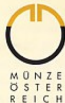
Cover: © IMAGNO/Austrian Archives