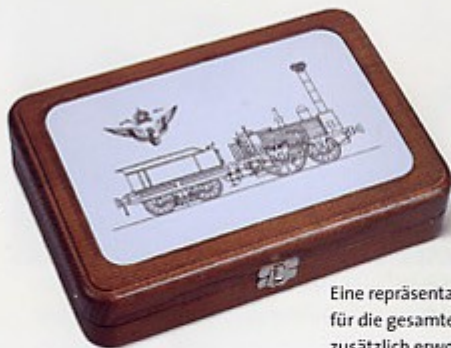
Eine repräsentative Holzkassette für die gesamte Serie kann zusätzlich erworben werden.

Die sechsteilige Münzenserie führt auf einen Streifzug durch die Geschichte der Eisenbahnen in Österreich. Beginnend mit der allerersten Bahnlinie, der „Kaiser-Ferdinands-Nordbahn“, dokumentiert die Serie die Eröffnung der Südbahn Wien–Triest vor 150 Jahren, die „Kaiserin-Elisabeth-Bahn“ (Westbahn) sowie die Hofzüge u. a. bis zu der Elektrifizierung der Strecken und dem modernen Bahnverkehr. Eine faszinierende Serie für alle Münzsammler, Eisenbahnfans und all jene, die Interesse an der Geschichte Mitteleuropas haben.