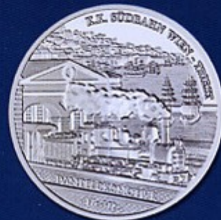
Cover: © Technisches Museum Wien