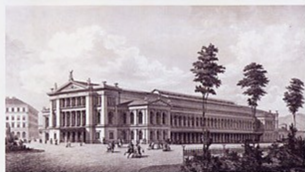
Der Südbahnhof entstand unter Direktor und Hauptarchitekt Wilhelm Flattich, von dem unter anderem auch die Bahnhöfe Graz und Triest stammen.

Durch die Bahnverbindung erlebte Triest großen wirtschaftlichen Aufschwung. Schon 1832 war der „k. k. privilegierte Österreichische Lloyd“ gegründet worden, und ab 1857 konnten Passagiere und Waren direkt zu den Schiffen gebracht werden. Die Reederei betrieb von Triest aus