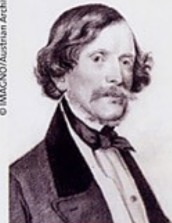
Karl Ritter von Ghega (1802–1860)

Zwei Jahre später erreichten die Gleise die Stadt Cilli, die damals noch zur Steiermark gehörte. Aber es dauerte weitere sieben Jahre, bis am 16. August 1849 der erste Zug bis nach Laibach fuhr. Hier wurde die feierliche Eröffnung vom erst 18-jährigen Kaiser Franz Joseph I. vorgenommen.